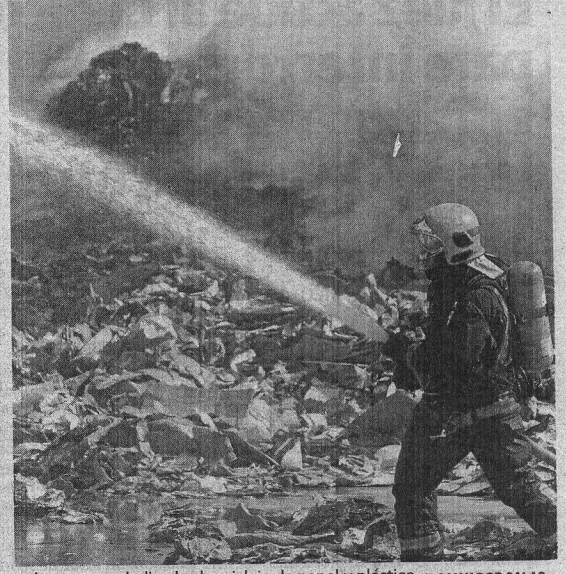
Un total de diez camiones y una treintena de bomberos trabajaron en la zona para sofocar las llamas, que afectaron la empresa dedicada al reciclaje de papel y plástico.